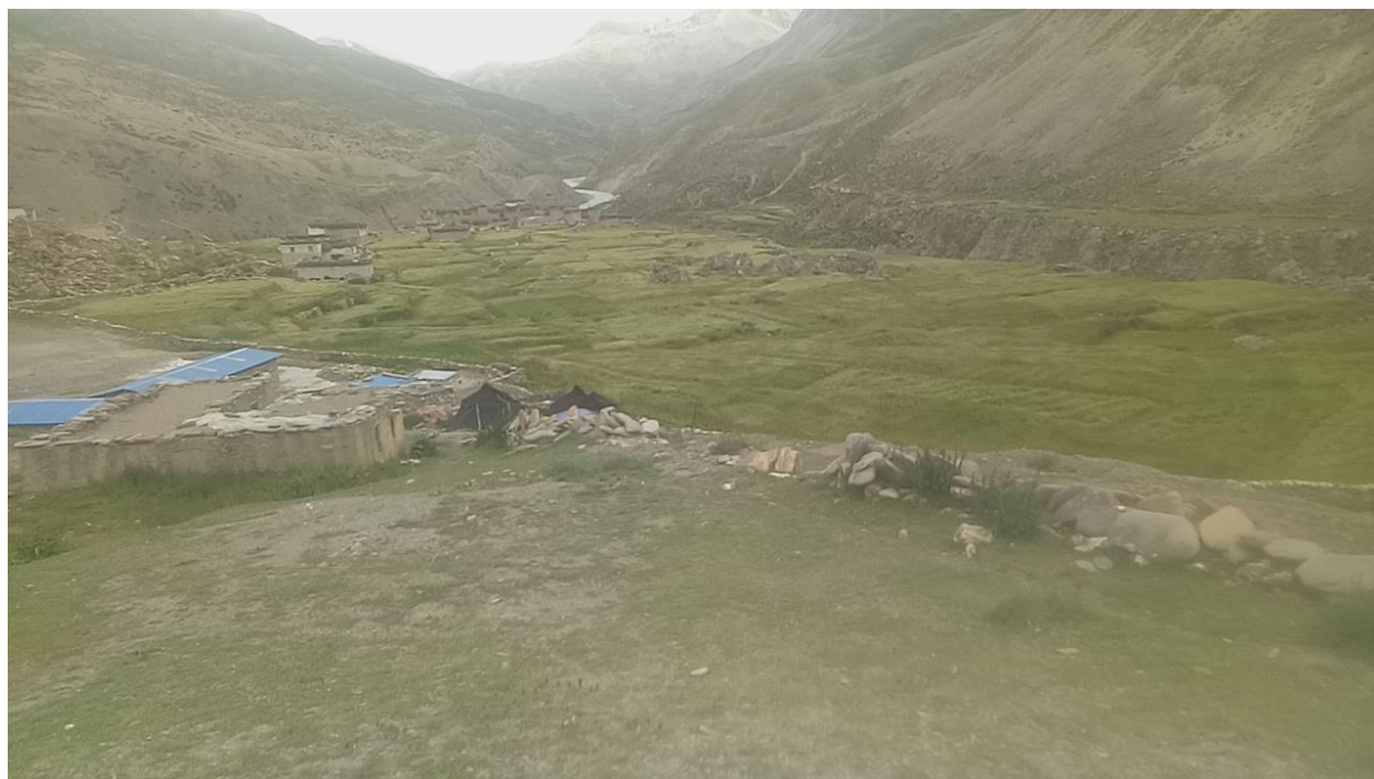
छार्का गाउँपालिकाको छार्काभोट गाउँ